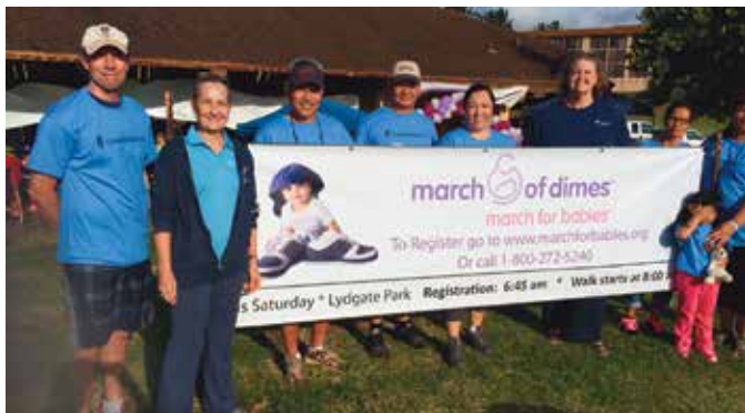
一角募捐步行基金會，為嬰兒行走募捐的步行活動 (March of Dimes, March for Babies Walk)，卡帕阿