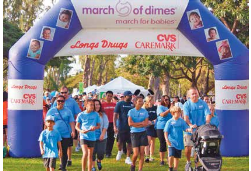
一角募捐步行基金會, 為嬰兒行走募捐的步行活動 (March of Dimes, March for Babies Walk), 火奴魯魯