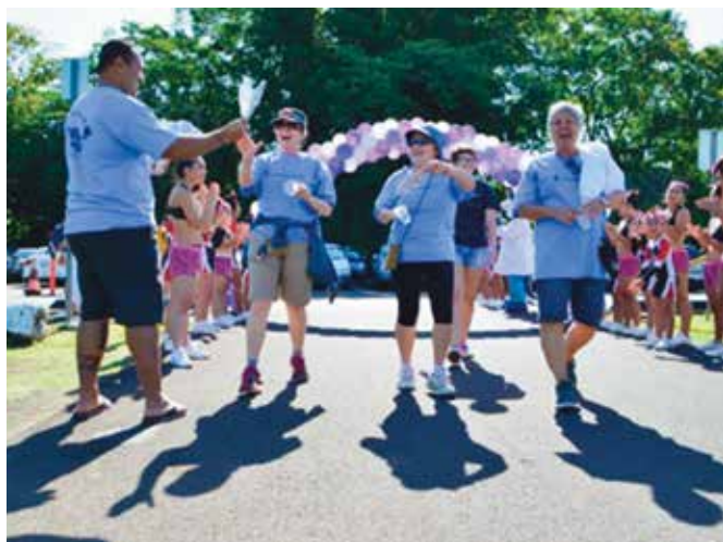
一角募捐步行基金會，為嬰兒行走募捐的步行活動 (March of Dimes, March for Babies Walk)，希洛