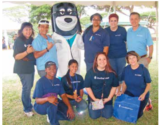
第 9 屆 年度懷厄奈海岸雙慶春節, 懷厄奈