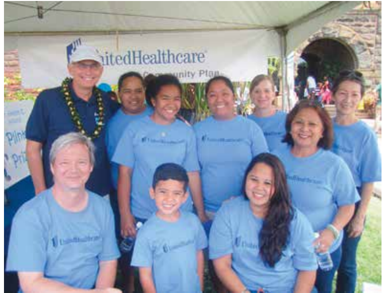
第 6 屆年度基督教青年會健康兒童日, 火奴魯魯