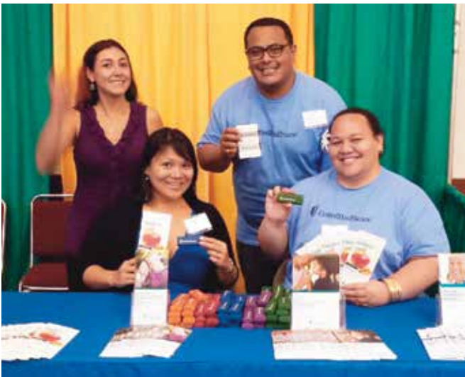
TCOYD 糖尿病大會暨健康博覽會, 火奴魯魯