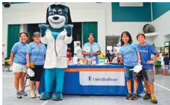
家庭慶祝日/珍惜兒童家庭活動，希洛