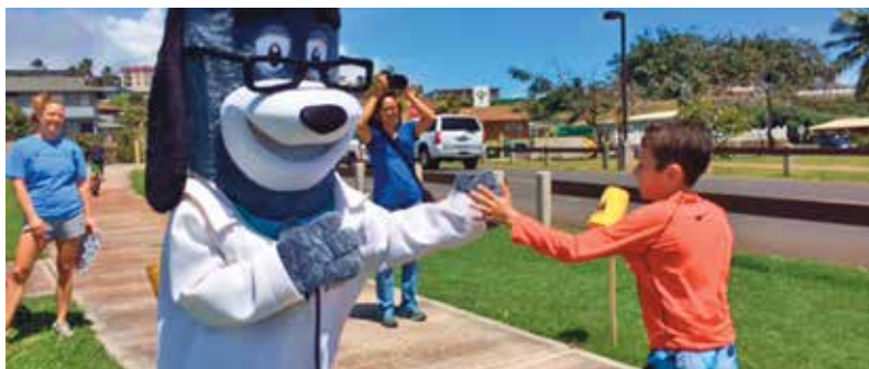
毛伊島基督教青年會健康兒童日 5 千米趣味跑，卡胡魯伊