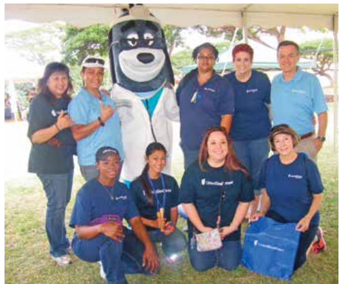
9th Annual Wai'anae Coast Keiki Spring Fest, Wai'anae