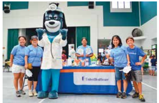
Celebrate Your Family / Cherish the Child Family Event, Hilo