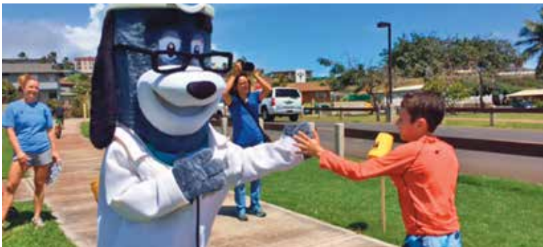
Maui Family YMCA Healthy Kids Day 5K and Fun Run, Kahului