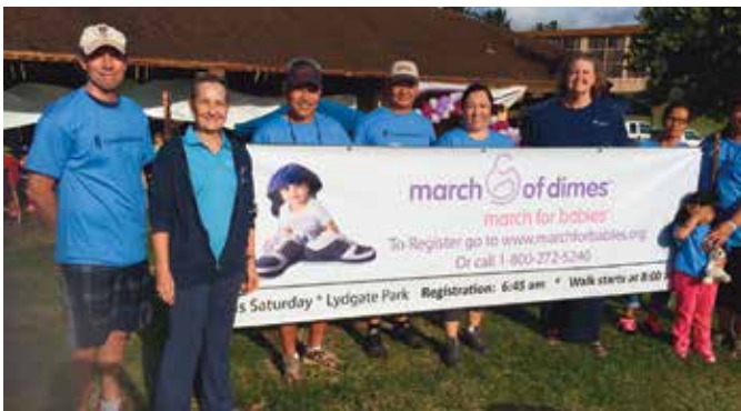
March of Dimes, March for Babies Walk, Kapa'a