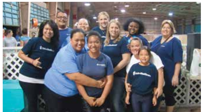
Next Step Shelter March Keiki Birthday Party, Honolulu