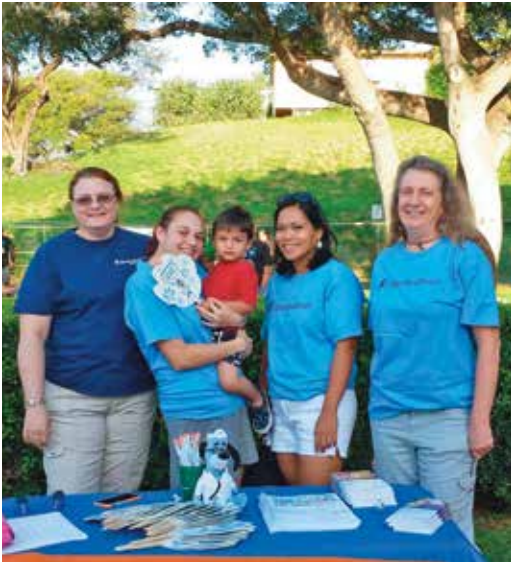
March of Dimes, March for Babies Walk, Kahului