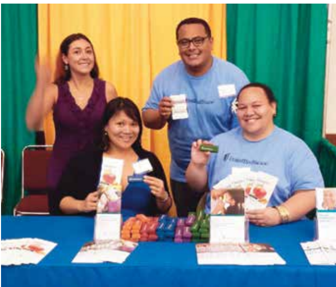
TCOYD Diabetes Conference & Health Fair, Honolulu