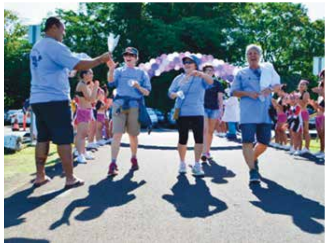
March of Dimes, March for Babies Walk, Hilo