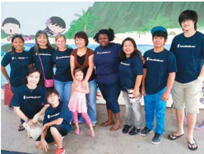
Next Step Shelter February Keiki Birthday Party, Honolulu

Nagboboluntaryo din kami upang masuklian ang mga komunidad kung saan kami nakatira at naghahanapbuhay. Pinapahalagahan namin ang mga ugnayan sa bawat taong nakakasama namin. Tingnan ang ilan sa aming mga kamakailang kaganapan kung saan nagkaroon kami ng pagkakataon na makiisa sa aming komunidad.